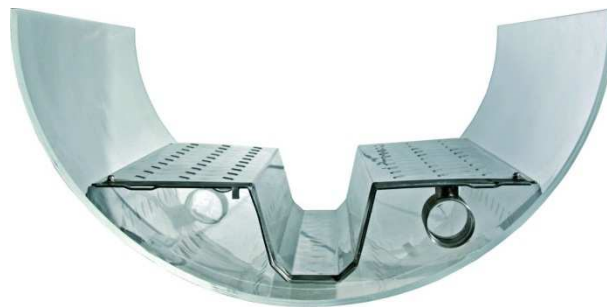
Kanaleinbauwärmetauscher © Firma Uhrig

Die Projektvorstellung findet am 16.03.2013 in den Räumlichkeiten des BKM Essen statt.