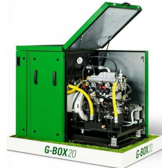
G-Box 20 BHKW

Der Wärmetauscher der Abwasserwärmesystems wird in den Abwasserhauptkanal vor dem Gebäude eingebaut.